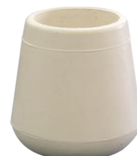
白ゴムキャップ φ28.6用