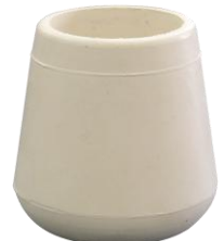
白ゴムキャップ φ28.6用

※このカタログの記載内容は、製品改良のため予告なく変更することがあります。 I2306